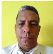
Por: Carlos Nobles

Cada día es más difícil encontrar seres humanos dedicados a servir de manera voluntaria sin esperar nada a cambio para su particular modo de vivir. Personas que cada día se levantan con el único fin de solucionar los problemas y necesidades que afrontan sus comunidades. Son muchos y cada uno diferentes situaciones que resolver pero con un pensamiento y sentimiento similar servir a los demás.