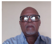
Por: Snider Montes

Los alcaldes, las administraciones municipales, deben ser "Agentes de Desarrollo", dinamizadores, facilitadores, actores y motores de procesos de desarrollo local, integral, democrático, participativo e incluyente.