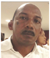
Por: Félix Beleño H.

En 1889 la nación contrató la construcción de un ferrocarril que comunicaría Cartagena con Calamar, sobre el río Magdalena. La obra se llevó a cabo en cinco años e incluyó la construcción del muelle la Machina sobre la bahía de Cartagena. Las obras del ferrocarril de Cartagena iniciaron en enero de 1890 y culminaron en agosto de 1894. La línea tenía una longitud de 105.6 kilómetros y once estaciones: Cartagena, El Tanque, Matute, Turbaco, Arjona, Arenal, Sopla viento y Calamar. El tren contaba con 4 locomotoras y 85 vagones.